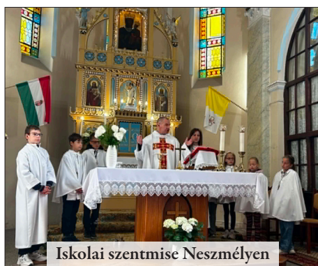
Iskolai szentmise Neszmélyen