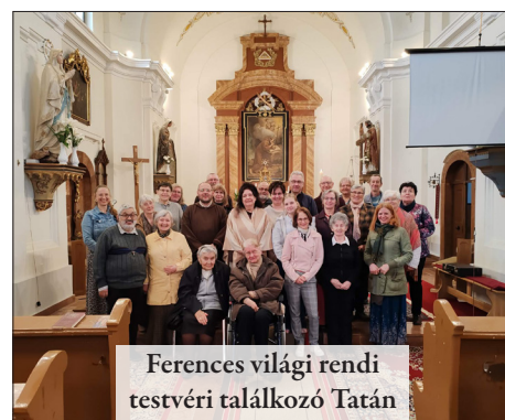
Ferences világi rendi testvéri találkozó Tatán