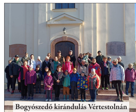
Bogyószedő kirándulás Vértestolnán