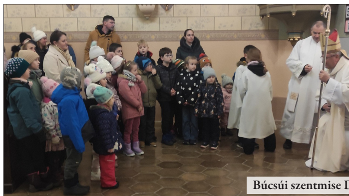
Búcsúi szentmise Dunaszentmiklóson