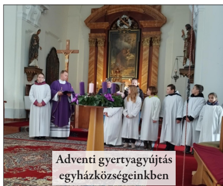
Adventi gyertyagyújtás egyházközségeinkben