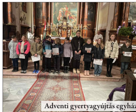
Adventi gyertyagyújtás egyházközségeinkben