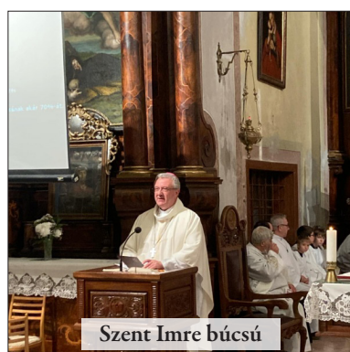
Szent Imre búcsú