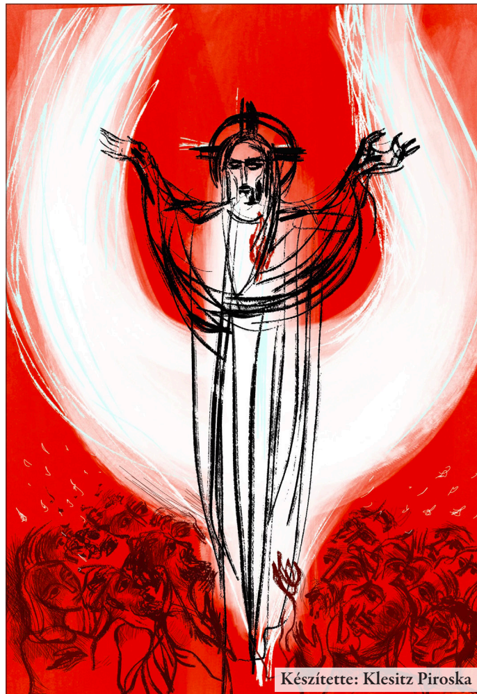
Készítette: Klesitz Piroska

A Szentlélek lángnyelvekben való megjelenése egyszerre hordozza magában a tűz mindkét tulajdon-