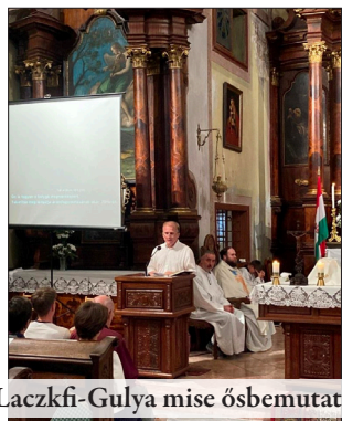
Laczkfi-Gulya mise ősbemutató