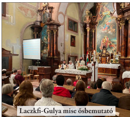
Laczkfi-Gulya mise ősbemutató