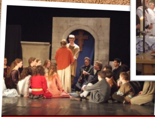
Ifjúsági kirándulás Szárligeten.€ € A székesfehérvári ciszterci gimnázium előadása Szent Ferencről a tatai művelődési házban.

5 " j Y h _ Y n ' g n z a ' _ f n ] f U h U ] b U _ ' ` Y U X z g ] ' \ U APOSTOL-5 ' D I G N H 5 ' @ v Å B A t a t a - h Æ é ç 9 f h c g ] ' G n Y d ` h f V = z a b E X Y [ f ^ W d Y W ] ' b É ç G n Y f _ Y g n h ] ' U ' g n Y f _ Y g n h ' V ] n c h h g z [ " ' 5 ' g Æ Internet honlap www. g totis. hu É: Y ` Y ` g ' _ ] U X Ç. É G n U " J Y h _ Y M c f d X z ç Y z ð d ð z ð h X Y b Y " n " ` ^ ` _ " ' ? f n ] f U h c _ U h ' b Y a ' f n - b _ ' a Y