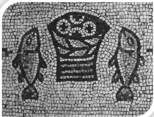
A cikkben említett mozaikról készített kép

Lakásunk egyik falán kicsi akvarellek idézik nyaralásaink, az otthonunktól távol, a családdal közösen töltött napokat. Új képecske került fel közéjük, talán eddig a legegyszerűbb, egy ügyesebb gyerek is megrajzolná. Egy kosarat ábrázol, benne kenyérek, körülötte két hal. Az eredeti mozaik egy V. században emelt kápolna padlóját díszítette. Az épület régóta nincs meg, sőt a padlót később magába foglaló bizánci bazilika sem. Az elmúlt század hozta, hogy a csodálatos kenyérszaporítás helyén a kövecskékből kirakott képet ismét épület fedi. Az eredeti alapokon egy