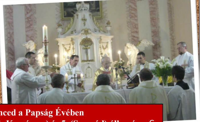
Az imakilenced a Papság Évében ~ 4. (Észak-Komárom) és 5. (Szomód) állomása. €