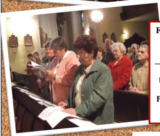
Ferences harmadrend fogadalmtétele (április. 28.). Templomunk felszentelésének 265. évfordulóján Dr. Paskai László bíboros atya. f